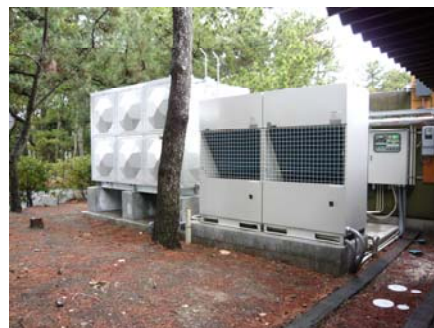
[開放式貯湯槽 + エコキュート]